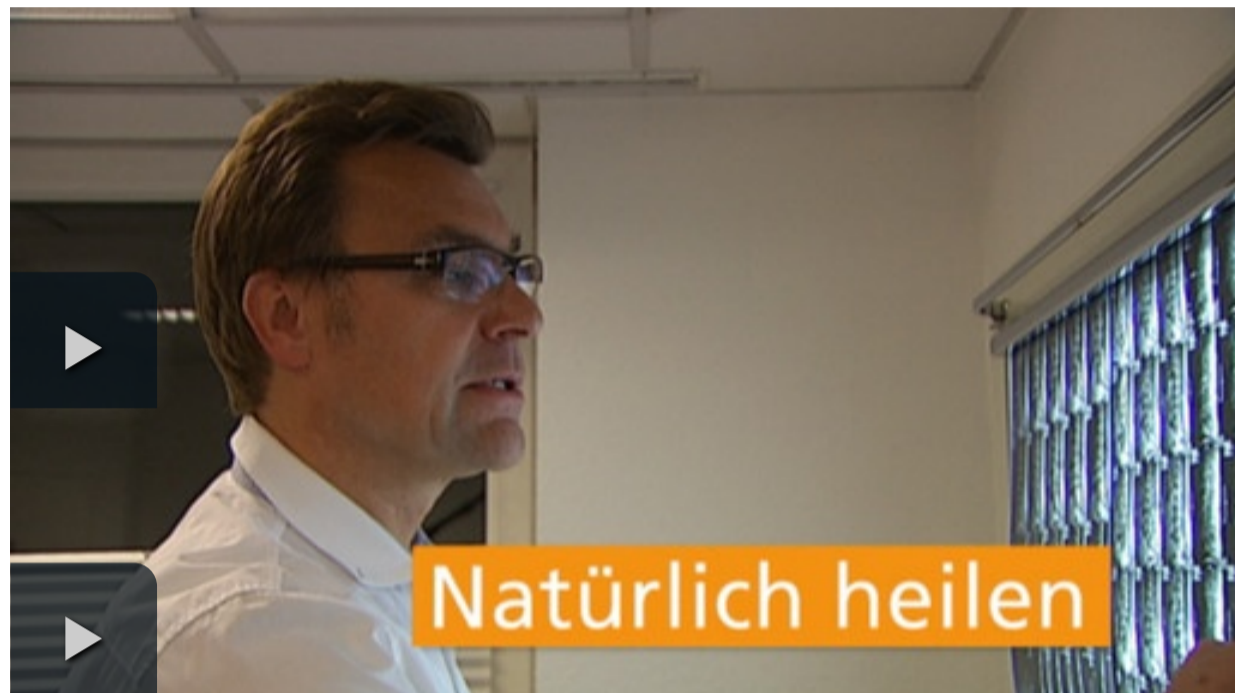
Video: Wochenserie: Natürlich heilen Einstellungen, Infos und Kommentare

Naturheilkunde – das klingt gut und ist populär wie selten zuvor. Schließlich geht es beim Heilen darum, Krankheiten wirksam und gleichzeitig so schonend wie möglich zu behandeln. Aber hilft nur die Naturheilkunde? Oder doch besser die wissenschaftlich basierte Schulmedizin? Vielleicht geht ja sogar beides zusammen? Das ist Thema der Wochenserie "Natürlich heilen".