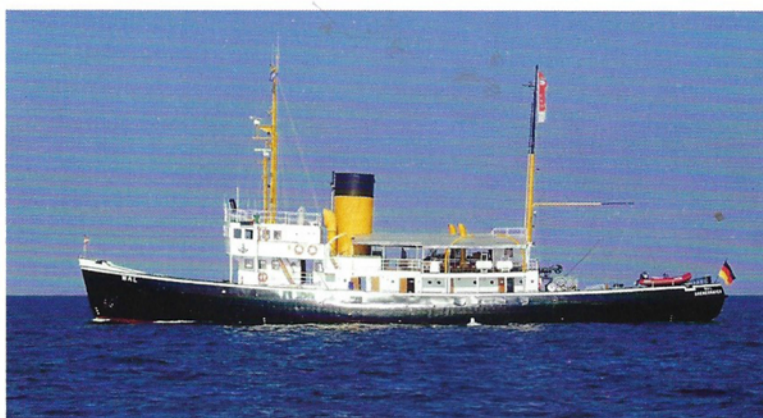
Wohin führt die Reise? Der Dampf-eisbrecher „Wal“ muss dringend renoviert werden, um weiter in Fahrt zu bleiben. Doch wer kommt auf für die Kosten in Millionenhöhe?

Für den besten Sound auf der Schiffsparade zum Deutschen Schifffahrtstag ist eindeutig der Bremerhavener Dampf-eisbrecher „Wal“ zuständig: Gleich vier Dampfpeifen sorgen für einen unvergleichlichen Klang und viel Applaus am Ufer und auf den anderen Schiffen. Doch in diesen Tagen ist das auch ein Not-signal: Die „Wal“ braucht dringend eine Kesselanierung, um in Fahrt zu bleiben. Aber noch fehlt dafür das Geld. Der „Sportschipper“ war an Bord auf einer der vielleicht letzten Reisen der „Wal“ – von Bremerhaven nach Bremen.